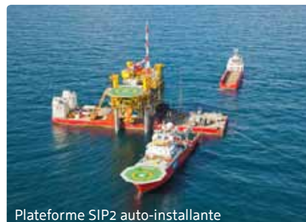
Plateforme SIP2 auto-installante

Les concepts SIP de SPT sont parfaitement adaptés aux plateformes de transformation et plateformes gazières/pétrolières en mer de 1.000 à 15.000 tonnes, voir image ci-dessous.