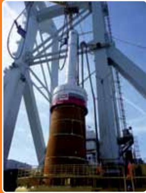
IHC Hydrohammer, Pile driving equipment