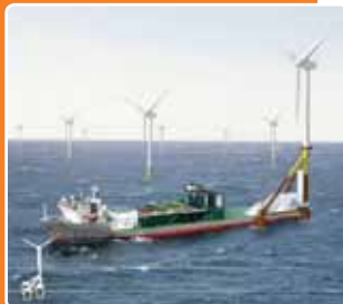
Eolienne autoinstallante SIWT