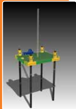
Système en conteneur